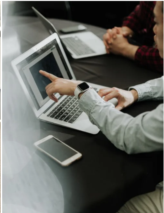
Adress: August Barks Gata 23 Plan: 3 Yta: 360 m 2 Lokaltyp: Kontor